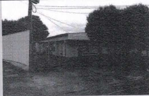
Registro de Localização.